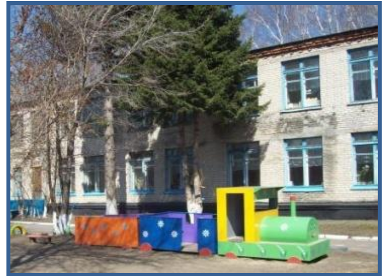
Детский сад - сегодня