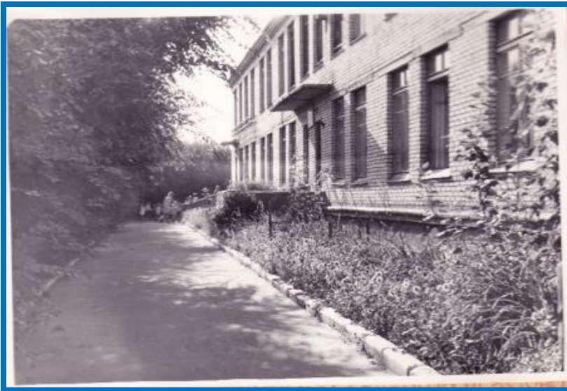
Наш детский сад 50 лет назад

В 1963 году детский сад уже провожал в школу своих первых выпускников. За 50 лет из стен нашего детского сада вышло свыше 2000 выпускников. Наши воспитанники, выбрав дорогу в жизни, становились медиками, учителями, воспитателями, инженерами, рабочими. Большинство из них остались жить и трудиться в родном городе.