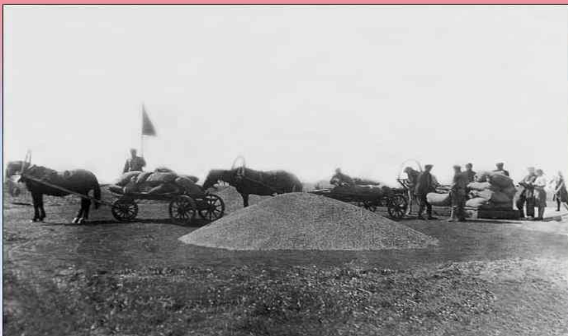
Обоз с хлебом для фронта. Колхоз им. К.Маркса Барнаульского района. 1944 г.

Промышленность страны получила для переработки более 3.5 млн. кож, 900 тыс. пудов шерсти и много другого сырья.