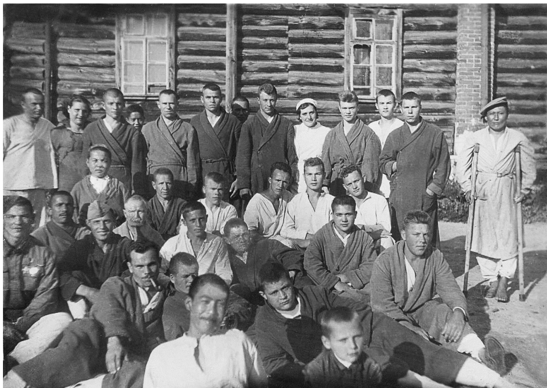
Барнаул, 1944 год

В годы Великой Отечественной войны на территории Алтайского края размещались 67 военных госпиталей, через которые прошло более 100 тысяч раненых бойцов и командиров.